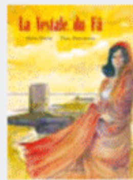
Format 23 x 30 cm 48 pages ISBN : 2-916104-11-9 2006 – 14 €