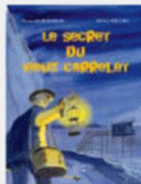
Format 23 x 30 cm 48 pages ISBN : 978-2-916104-83-6 2009 14 €